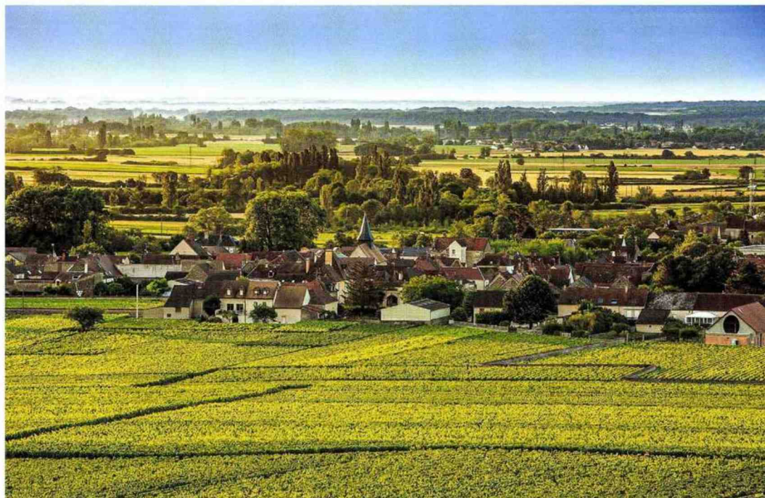
Le domaine compte aujourd'hui vingt-cinq hectares sur la zone de Puligny-Montrachet. L'implantation en Mâconnais, initiée en 2004, représente une quarantaine d'hectares. Récemment, des plantations ont été faites en appellation hautes-côtes-de-beaune.